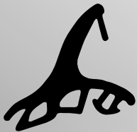
VD6027A VEDANTE CENTRAL QTD. ROLO: 60