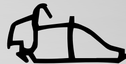
VD6054 VEDANTE CENTRAL QTD. ROLO: 40