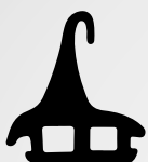
VD6018 VEDANTE CENTRAL QTD. ROLO: 80