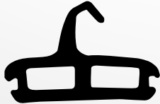
VD6026 VEDANTE CENTRAL QTD. ROLO: 70