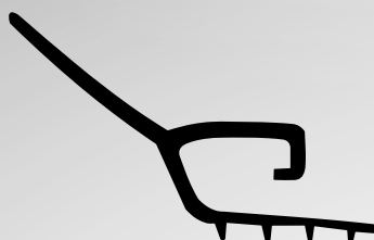
RM6118 VEDANTE LATERAL QTD. ROLO: 100