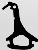
VD6028 VEDANTE CENTRAL QTD. ROLO: 100