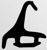
VD6025 VEDANTE CENTRAL QTD. ROLO: 80