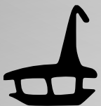
VD6011 VEDANTE CENTRAL QTD. ROLO: 80