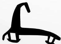
VD6097 VEDANTE CENTRAL QTD. ROLO: 60