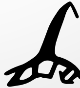
VD6027 VEDANTE CENTRAL QTD. ROLO: 60