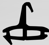
VD6013 VEDANTE CENTRAL QTD. ROLO: 70