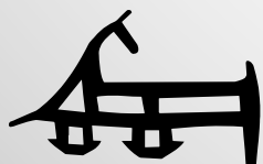
VD6096 VEDANTE CENTRAL QTD. ROLO: 50