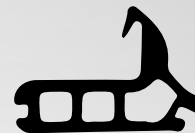
VD6060 VEDANTE CENTRAL QTD. ROLO: 50