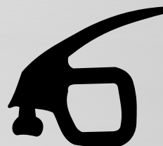
RM6116 VEDANTE SUPERIOR QTD. ROLO: 75