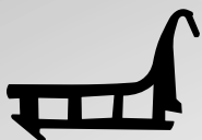
VD6015 VEDANTE CENTRAL QTD. ROLO: 50