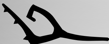
RM6115 VEDANTE LATERAL QTD. ROLO: 100