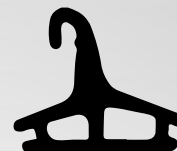
VD6017 VEDANTE CENTRAL QTD. ROLO: 80