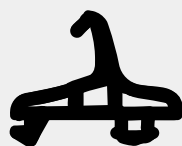
VD6074 VEDANTE CENTRAL QTD. ROLO: 70

AS IMAGENS NÃO SE ENCONTRAM À ESCALA REAL