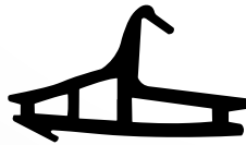
VD6022 VEDANTE CENTRAL QTD. ROLO: 50