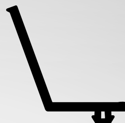
RM6124 VEDANTE INFERIOR QTD. ROLO: 100

AS IMAGENS NÃO SE ENCONTRAM À ESCALA REAL