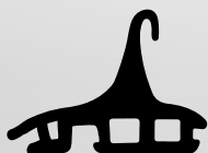
VD6142 VEDANTE CENTRAL QTD. ROLO: 60

AS IMAGENS NÃO SE ENCONTRAM À ESCALA REAL